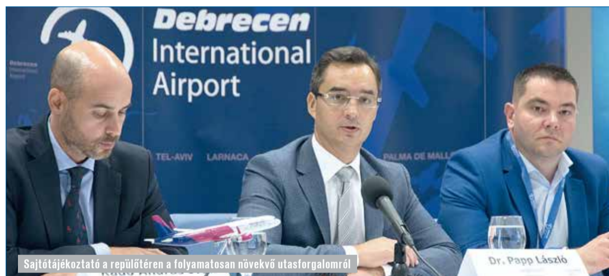
Sajtótájékoztató a repülőtérre a folyamatosan növekvő utasforgalomról

Az Új Főnix Terv nagyon fontos fejezete az Élhető város. Ennek