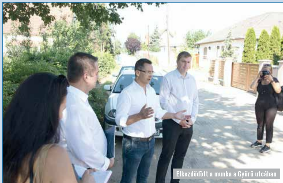
Elkezdődött a munka a Gyűrű utcában