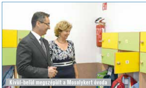
Kívül-belül megszépült a Mosolykert óvoda

A debreceni önkormányzat összesen 2,8 milliárd forintot költ óvodai korszerűsítésére.