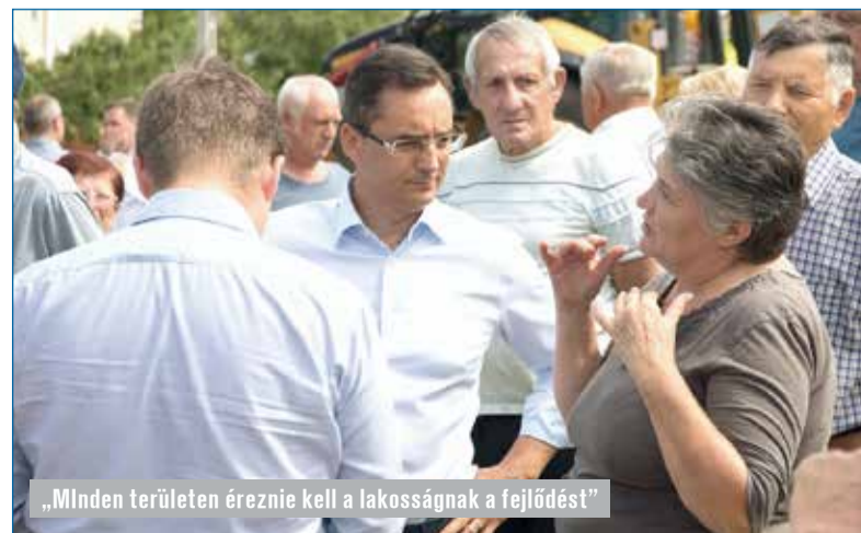
„Minden területen éreznie kell a lakosságnak a fejlődést”

része a Zöld város program, mely a város közterületeinek megújítását szolgálja. Több helyen folynak a kivitelezési munkálatok, a Dobozi-kertben, a Vénkertben, a Libakertben és a Sestakertben. Most véglegesítettük a Tócsókert és a Tócsó-völgy zöldterületi megújításának programját és rövidesen ott is el tudjuk indítani a közbeszerzési eljárást. Folynak a munkák, fontos, hogy a lakókörnyezet igényes legyen, hogy a debreceniek valóban ott-