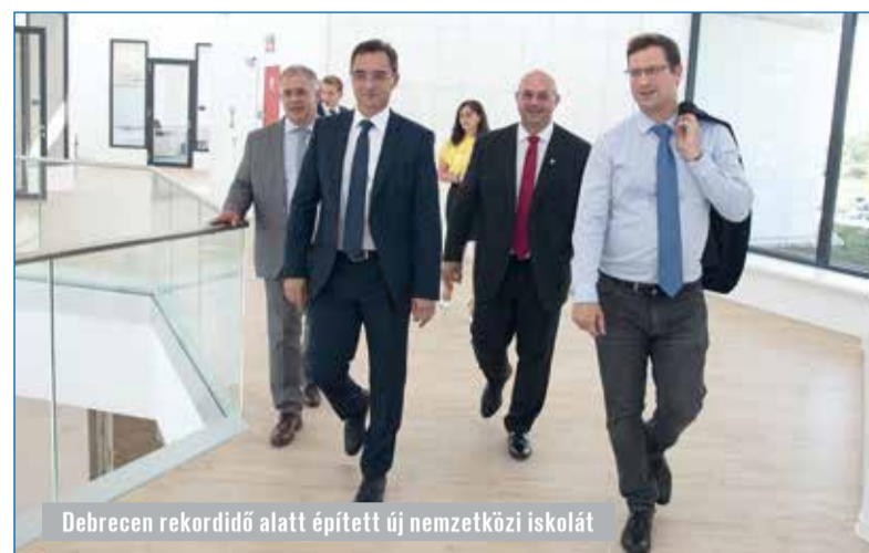
Debrecen rekordidő alatt épített új nemzetközi iskolát

honosan érezhessék magukat. A lakótelepek közterületeinek, zöldfelületeinek legnagyobb felújítási programját tudtuk elkezdeni az Új Főnix Terv keretében. Volt már olyan, az Újkerteret érintő közbeszerzési eljárásunk, ami eredménytelenül zárult, de ezt rövidesen újra ki tudjuk írni, és elkezdjük ott is a kivitelezési munkálatokat. Az Újkerter is egy nagyszabású fejlesztési terület lesz, ahol megújulnak a közterek és a parkok.