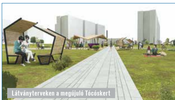
Látványterveken a megújuló Tócsóskert

A két városrész megújítására uniós pályázaton nyert forrást az önkormányzat.