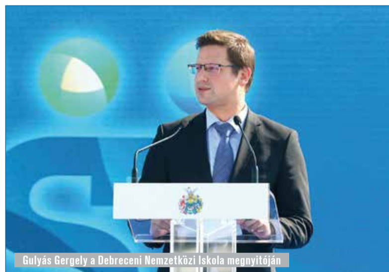
Gulyás Gergely a Debreceni Nemzetközi Iskola megnyitóján

– Debrecenben hosszú távú, több évtizedes városfejlesztés zajlik. Nem szét-húzás, hanem egy belső összefogás van a városban, és emellett ott a világos városfejlesztési koncepció is. Rádadásul