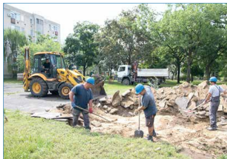
Korszerűsítik a parkokat és a közösségi tereket a lakótelepen Fényes udvari tömbbelsőben

MÁR BIRTOKBA VEHETTÉK a teljesen megújult Arany János téri sportpályát a környéken élők. Itt kialakítottak egy KRESZ-pályával körbevett játszótérrel is, ahol a legkisebbek mellett a mozgássérült fiatalok is biztonságban sportolhatnak. A fejlesztésekkel valamennyi generáció igényét szeretnék kiszolgálni.