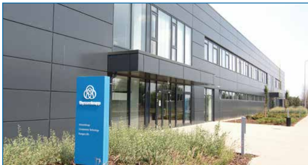
Olyan cégek érkeztek Debrecenbe, mint a Continental, a Kronos, vagy a Thyssenkrupp (képünkön)

Például utak építésébe, intézményi és létesítményfejlesztésekbe, jóléti fejlesztésekbe, és az üzemeltetési feladatok tekintetében is több lehetősége lesz a városnak. Ez óriási előny. Konkrét számokat még nem lehet mondani, de meg kell nézni Győr és Kecskemét adóbevételeinek alakulását a két nagy autógyár érkezését követően, hiszen elképesztő jelentősége van a helyi adó-bevételek szempontjából, és nyilván ez Debrecen esetében is komoly előrelépést jelent majd. Minden bevétel, ami a város számlájára, költségvetésébe beérkezik, az a debreceniek érdekét szolgálja.