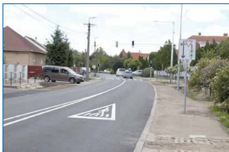
Egészen más élmény ma a felújított Gázvezeték utcán és a Mikepércsi úton közlekedni

A kivitelezési munkákat követően a Kismarja utca utépítéssel érintett szakaszán, a Tégláskert utca irányából a Szepesi utca irányába egyirányúvá válik a forgalom.