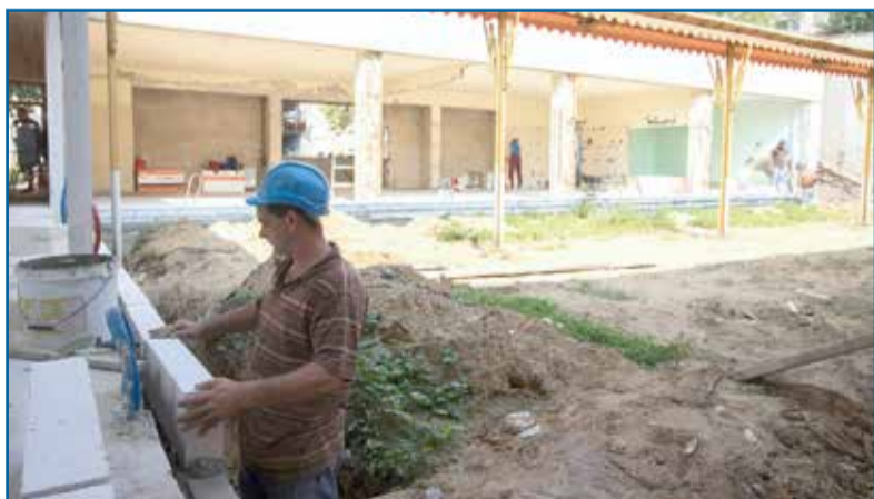
Folyik a munka, dolgoznak a Karácsony György utcai intézményben

Nagyszabású, komplex felújítás kezdődött a Karácsony György utcai bölcsődében, mely során az intézmény kívül és belül is teljesen megújul.