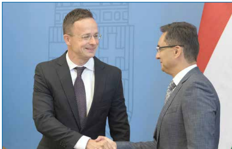
Sziijártó Péter külgazdasági és külügyminiszter gratulál Debrecen polgármesterének

Az elsődleges cél az volt, hogy a BMW Magyarországot válassza. A magyar kormány sikeres gazdaságpolitikája és adópolitikája rendkívül fontos szerepet játszott abban, hogy a német autógyártó végül hazánk mellett döntött. Az elmúlt éveket a magyar gazdaság megerősítése szempontjából abszolút sikertörténetnek minősíthetjük. A kormány kiemelten kezeli Debrecen, ezt mutatják az eddigi eredmények is, valóban minden támogatást megkaptunk, de azért azt szeretném hangsúlyozni, hogy ez egy komoly verseny volt, ahol végső soron a befektető választotta ki azt a várost, ahol fejlesztetni fog.