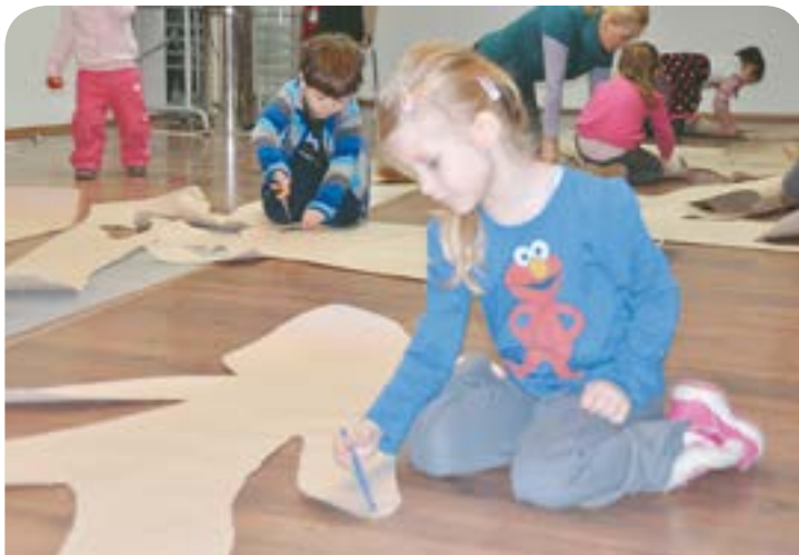
Átkombákom: alkotókör apróságoknak a Modemben

DEBRECEN–RACIONET Honvéd férfi bajnoki vízilabda-mérkőzés a Sportuszodában.