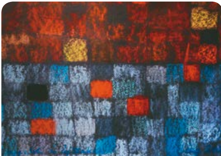
Láng Eszter képei a Csokonai-gimnáziumban láthatók december 31-ig

▶ December 30., kedd, 19 óra Előszilveszteri Zeneexpressz – Fásy-mulató a Kölcsey Központban.