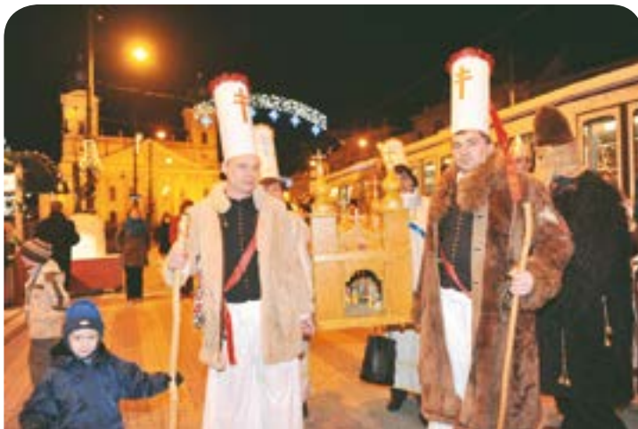
Újra betlehemes találkozó helyszíne lesz a cívisváros

▶ December 16., kedd, 18 óra Modem-filmklub. Bob Fosse: Kabaré (1972).