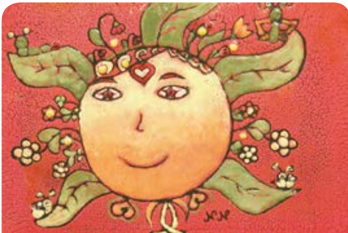
A Tájéoló Tűzzománc Szakkör tárlata a Belváros Galériában látható december 15-ig

Lurkó-kuckó kiskamaszoknak a Kőrösi Csoma Sándor Tagintézményben.