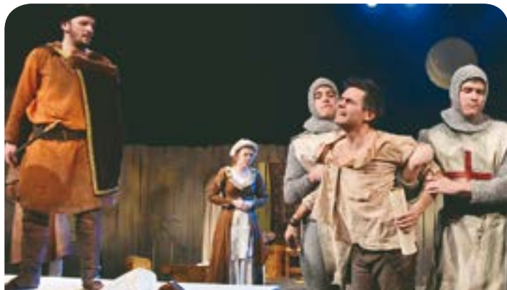
A dühös lovak – Lackfi János darabja a Vig Kamaraszínházban megy

► December 6., szombat Mikulás-nap a Déri Múzeumban . Ezen a