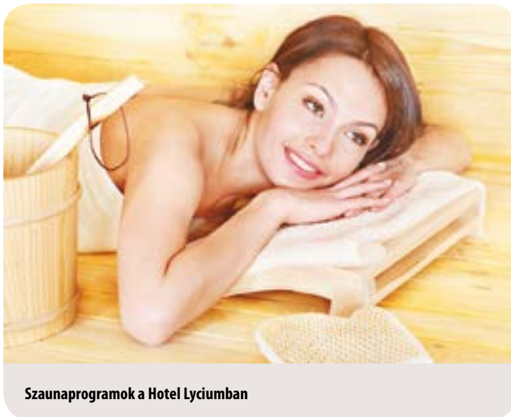
Szaunaprogramok a Hotel Lyciumban

a Belvárosi Közösségi Házban. Kézművesvásár és -bemutatók a régi városháza bejáratánál és emeleti folyosóján. 11 órától karácsonyváros kézműves-foglalkozás (fenyőfadisz-készítés).