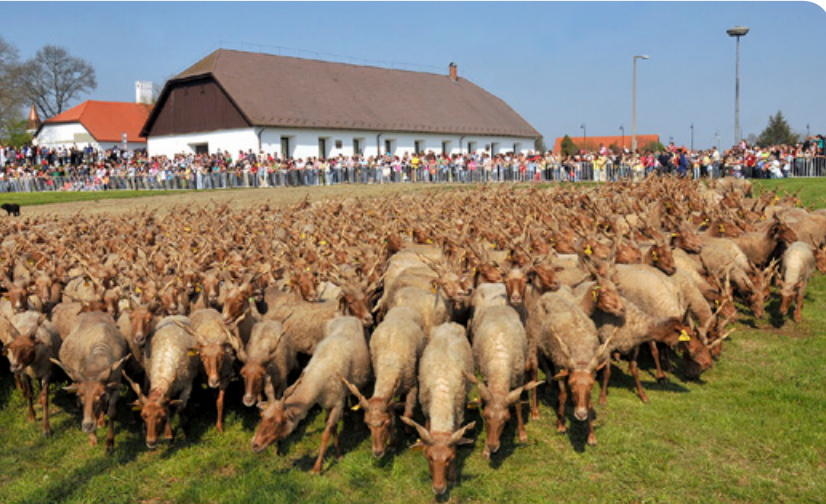
Hosszú hétvége a Hortobágyon. Gazdag pusztai program várja az érdeklődőket április 28. és május 1. között

▶ Április 26., csütörtök Bemutatkozik a Debreceni Egyetem Angol–Amerika Intézete – egész napos programok a Méliusz-központban.