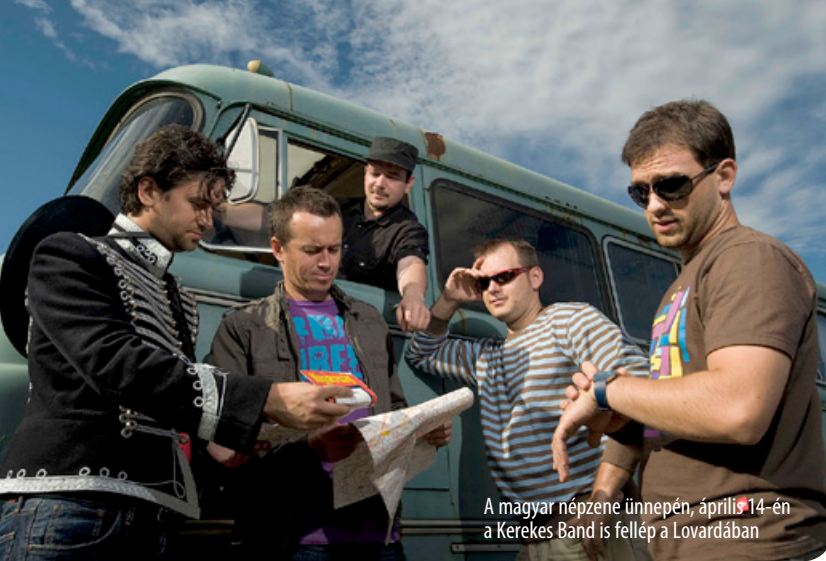
A magyar népzene ünnepe, április 14-én a Kerekes Band is fellép a Lovardában