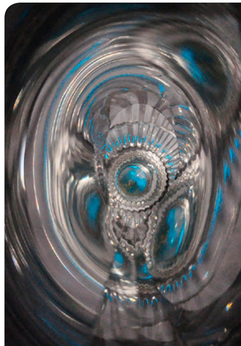
Endes Mihály fotográfus képei a DOTE Elméleti Galériában április 13-ig láthatók

▶ koncert ▶ kiállítás ▶ rendezvény ▶ színház ▶ sport ▶ egyetemi centenáriumi