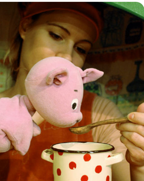
A kismalac és a farkasok: kézműves-bábkészítő április 17-én és 24-én a Vojtinában

▶ Április 11-ig XXI. Debreceni Tavaszi Tárlat a Kölcsey Központ Béni Árpád-termében. Megtekinthető hétfő kivételével naponta 10–19 óráig.