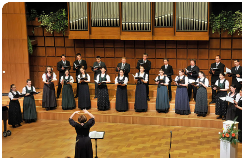
Vasárnapi muzsika: április 15-én a Canticum Novum Kamarakórus lép fel a Kölcseyben

▶ Április 20. A Duna-Tisza közti népművészeti egyesület kiállítása a Tímárházban.