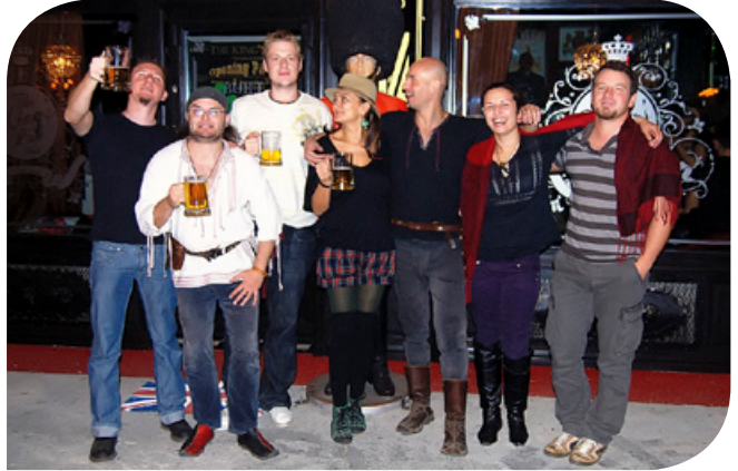
Van: mindenki a saját stílusát hozta, ettől működik

A Van hamarosan stúdióba vonul, s egy 8–9 számú albumot rögzítenek. A lemez szerzői kiadásban jelenik majd meg. A basszista ezzel kapcsolatban