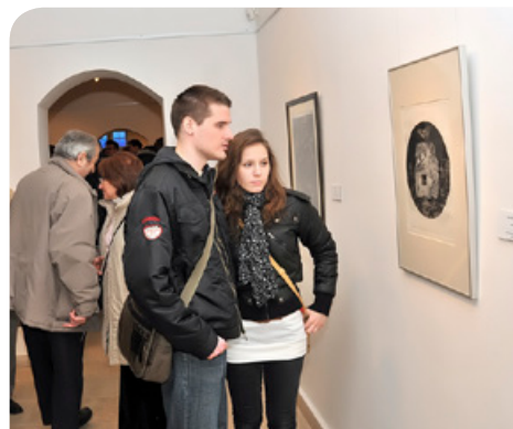
Baráti üdvözlettel. Maximum 60 centis körök. – A Múterem Galériában április 15-ig látható a tárlat