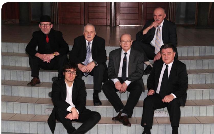
Neo bop, electronica, pop jazz, smooth jazz a Debrecen Jazz Group-pal a Kölcseyben április 10-én

▶ Április 7., szombat 10 óra Szombati műhely – játszóházi foglalkozás családoknak. Húsvéti tojásfestés, fényképtartó készítése a Timárházban (Nagy Gál István u. 6.). Részvételi díj: 150 Ft/fő.