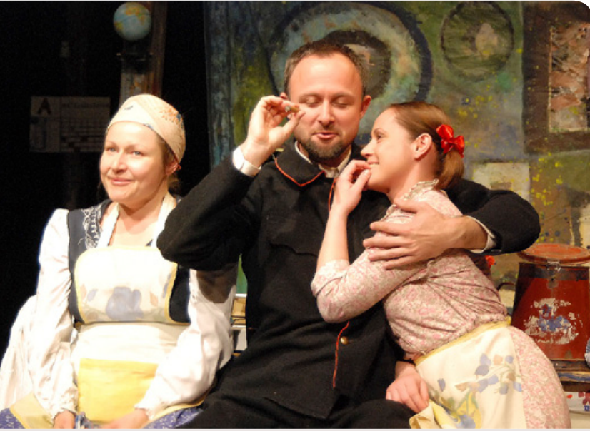
A beregszászi társulat egyik legnevesebb előadásával köszönti a 100 éve született Örkény Istvánt a Csokonai Színház április 19-én

▶ Április 20., péntek Csányi-Kowalsky akusztikus koncert a Ronce Bárban.