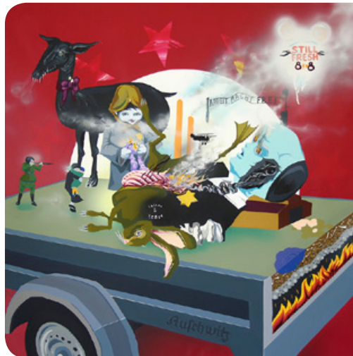
Zéró évek: a szlovák vizuális művészet 1999 és 2011 közötti korszakát mutatja be a Modem tárlata