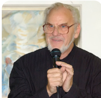
Beszélgetés szeretetről, szerelemlről, szeretkezésről. Müller Péter estje a Kölcsy Központban május 8-án

31. Űszó-Európa-bajnokság a Sportuszodában.