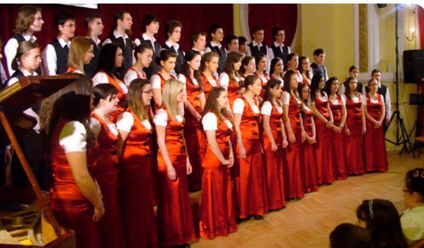
Éneklő ifjúság: városi minősítő hangversenyt tartanak a Belvárosi Községi Ház Pódiumtermében április 14-én

▶ Április 17., kedd 19 óra Illúziók. Vig Kamaraszínház, Szabó Magda-bérlet. Látja Isten, hogy állok a napon. Horváth Árpád Stúdiószínház, bérletszűnet.