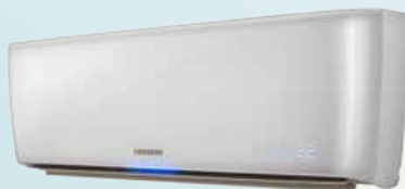
JUNGFRAU 239 000 Ft-tól