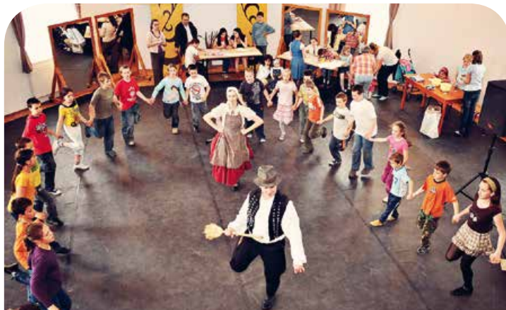
Cívís cuhárá. Kárpát-medencei népművészeti találkozó október 25-én

▶ Október 26., szombat, 10 óra Hálaadó szentmise a Debrecen-Nyíregyházi Egyházmegyei Karitás és a Kelet Karitás Alapítvány 20 éves évfordulója alkalmából a Szent Anna-székesegyházban. A szentmisén közreműködik az Imperfectum együttes.