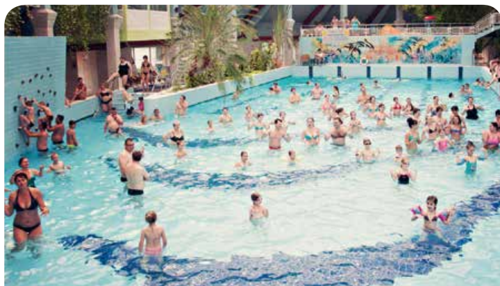
Vasárnapi „vizes” program ősszel is: zumba az Élményfürdőben

▶ Október 18., péntek, 20 óra Depeche Mode-est az Ifjúsági Házban. Personal Mode- és LED-koncertek a Dharma Klubban.