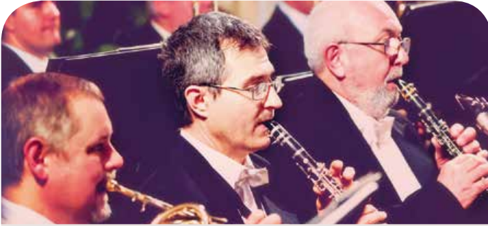
Két koncerten is hallhatjuk októberben a Kodály Filharmonikusokat: 26-án Strauss- és Mahler-, 31-én Schumann-, Brahms- és Beethoven-műveket adnak elő

▶ Október 26., szombat, 10 óra Séfakadémia. Halloween-party, 1. Helyszín: Karinthy Frigyes u. 16.