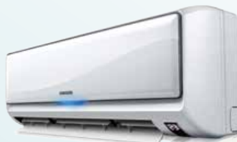
CRYSTAL 209 000 Ft-tól