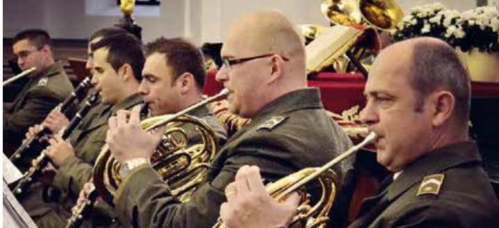
A Pénzügyőr Zenekar november 11-én a Kölcsey Központban ad koncertet

▶ November 9., szombat, 10 óra KreDenc alkotói piac a Malomparkban.