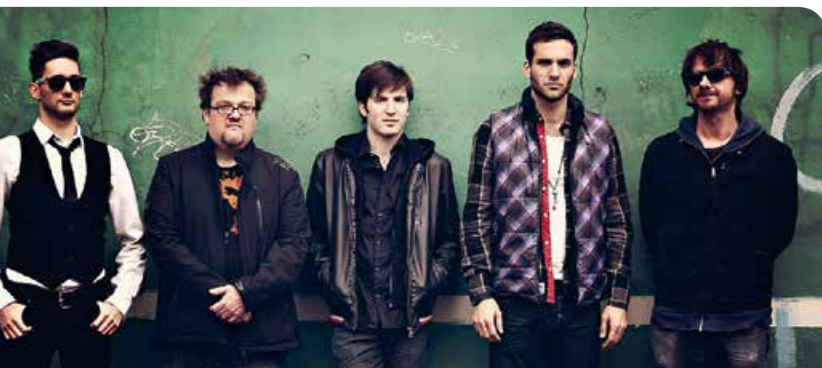
Carbonfools: koncert a Lovardában november 13-án