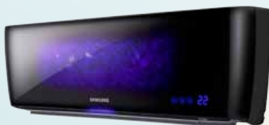
JUNGFRAU 269 000 Ft-tól

Tegye komfortosabbá életét télen-nyáron!