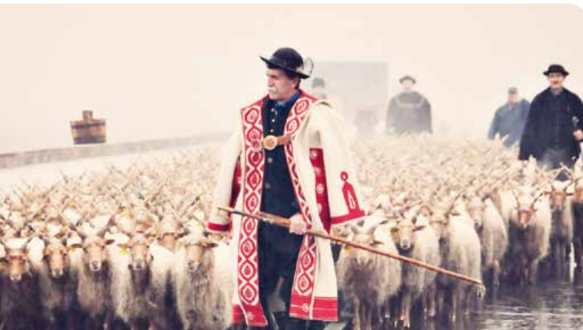
Behajtási ünnep a Hortobágyon október 26-án

▶ Október 29., kedd 10.30 óra: Hangbújócska-zenebölcsi a Méliusz-könyvtárban. 16 óra: Társasjátéklklub.