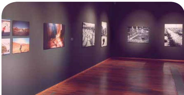
Szent utak. Arab fotóművészek munkái láthatók a Modemben

▶ Október 31., csütörtök, 12 óra Termelői udvar az Ifjúsági Házban.