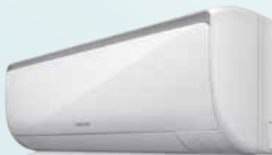
MALDIVES 149 000 Ft-tól