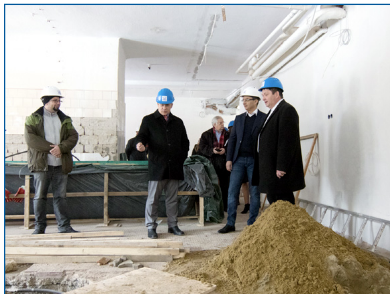
Felújítják a Nagyerdei Óvodát is...

Kósa Lajos, a modern városok fejlesztéséért felelős tárca nélküli miniszter azt hangsúlyozta, családbarát országot szeretnének építeni, s ezt szolgálják az óvodai fejlesztések is.