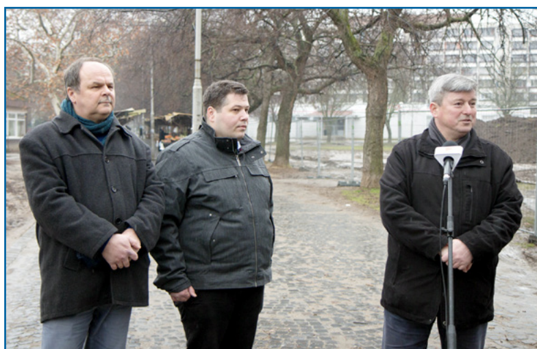
Jó hírt jelentettek be a képviselők a tócoskertieknek: elindult a piac építése

A piac fedett lesz, s bár üvegfallal határolják majd, nem lesz teljesen zárt. A tervek szerint 68 darab új árusító asztalt helyeznek majd el