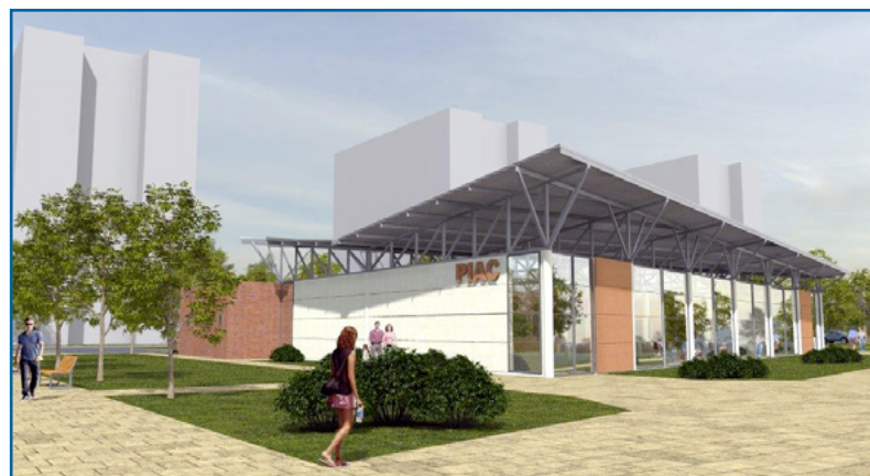
Megvalósul a tócoskertiek régi álma: nem csak új piac épül, a területen további fejlesztések várhatók

Ha minden pályázatuk sikeres lesz, a város több mint egymilliárd forintot fordíthat a tócoskerti városrész fejlesztéseire.