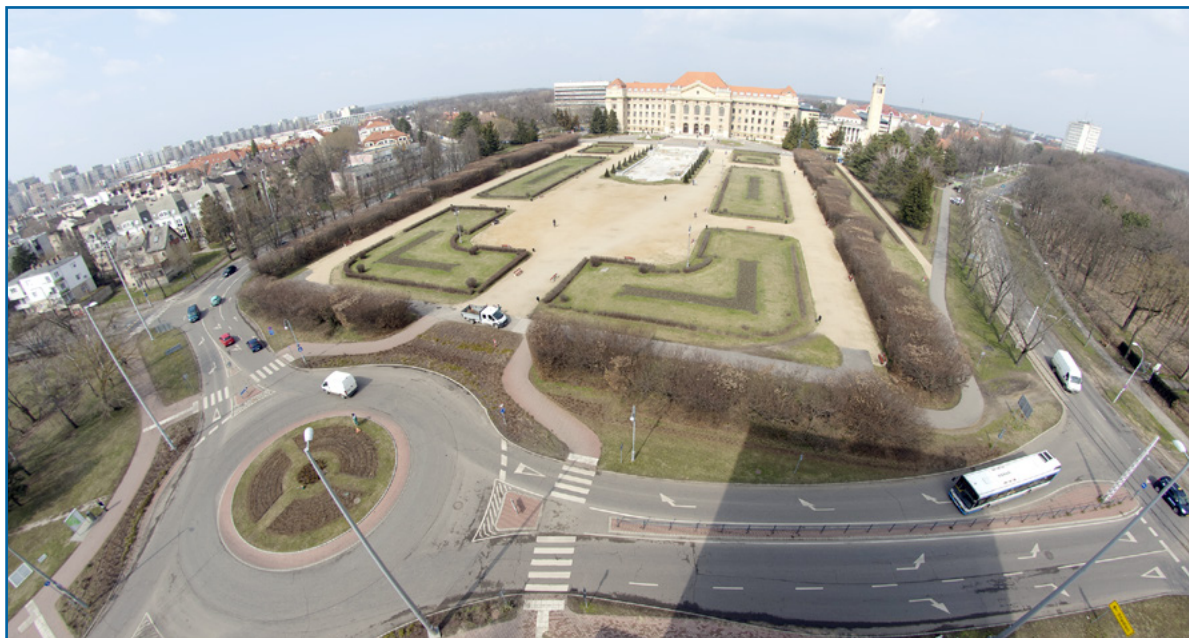
Áprilisban elindul a munka az Egyetem téri körforgalomnál

Gyorsabban és biztonságosan lehet majd közlekedni a Debreceni Egyetem főépületénél is. Az Egyetem téren található körforgalom 8 méter szélességű egysávos körgyűrűjét oly módon alakítják át, hogy azt követően két 4 méter széles forgalmi sávban lehet majd használni a körpályát.