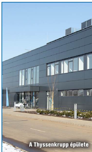
A Thyssenkrupp épülete

A gépiparban jellemzően a már Debrecenben működő cégek (FAG, Flexiforce, Axiál, Zolend) fejlesztenek. Itt új szereplő a német Kronos, amely élelmiszer-ipari gépeket fog gyártani a Déli Ipari Parkban épülő üzemében.