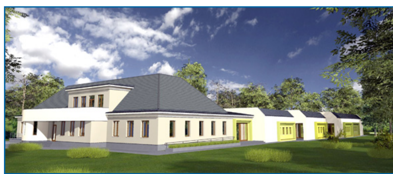
...ami ilyen szép lesz, amikor elkészül