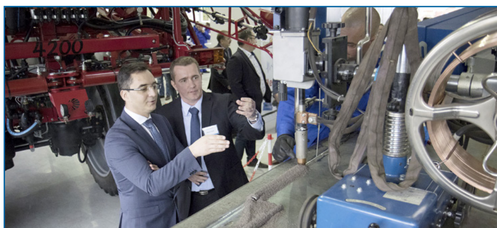
A Zolend új, 1300 négyzetméteres üzemcsarnokát 2017 tavaszán adták át