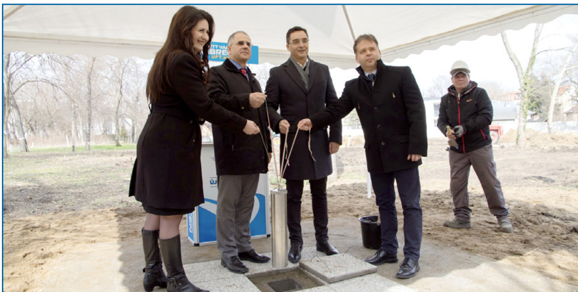
Lerakták az alapkövet. A Nádor utcán, az egykori Ifjúsági Park helyén építeti fel az önkormányzat a Család- és Gyermekjóléti Központot, melynek közel 14 ezer négyzetméteres parkja nyitva lesz mindenki előtt. Az épület földszintje 854, az emelet 492 négyzetméteres lesz, s tartozik majd hozzá egy 57 négyzetméteres fedett terasz is

Részben az ilyen típusú fejlesztések iránti elkötelezettség bizonyosságaként, részben a hangsúlyozás miatt következzen itt néhány adat! A város önkormányzata februárban alkotta meg az idei költség-