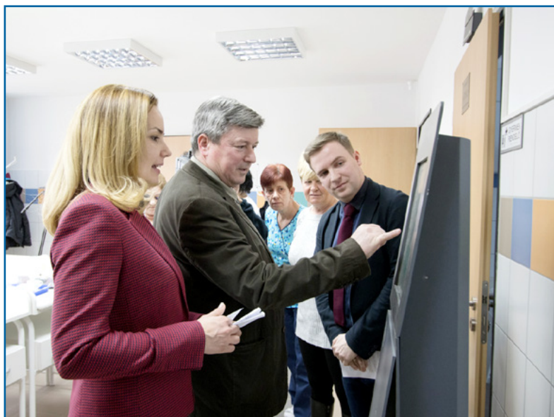
Megszépült a Híd utcai rendelő is

Debrecen önkormányzata az Új Főnix Tervben kiemelten kezeli a városi óvodák fejlesztését annak érdekében, hogy a gyermekek a