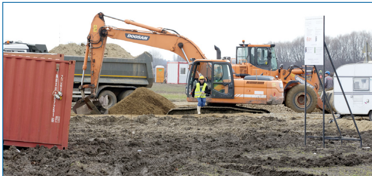
A 200 hektárnyi, városi tulajdonú terület közművesítésén már dolgoznak a szakemberek

gazdaságfejlesztés sikertörténete Debrecenben, akár 18 ezer ember is dolgozhat majd Debrecen új ipari parkjában.