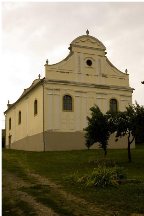
A felújított zsinagóga