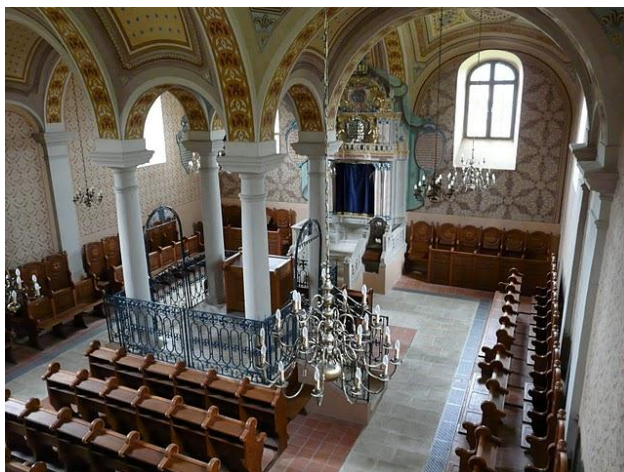
A zsinagóga belülről

http://www.jmpoint.hu/modules.php?name=News&file=article&sid=419 )