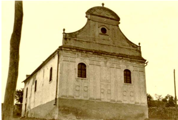
A zsinagóga a háború után